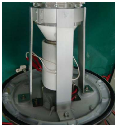
55W用放熱対策増強アルミステー例