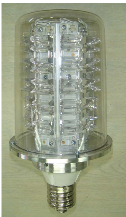
ご参考:開発中品外観35/55W共通

自動車用ヘッドランプで培われた独自の配光制御技術と高出力LEDを組み合わせることにより、水銀灯代替照明等に最適なE39口金対応LEDユニットを実現しました。用途に合わせ、上向き下向き取り付けを選択いただけます。